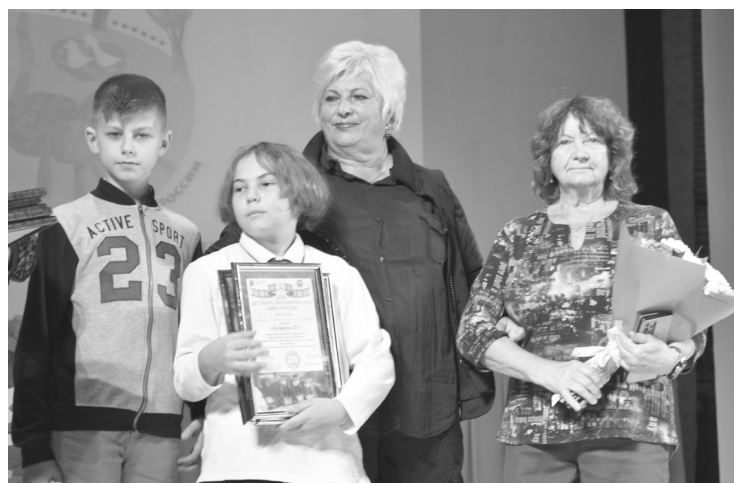
● Награждение студии «Совенок» г. Сланцы

шли к созданию картины: описывая природу вокруг себя, в закадровом тексте они использовали только глаголы. Лучшими анимационными фильмами стали два: «Три поросенка и экология» из Твери и «Елочка, живи!» из Республики Башкортостан. Оба созданы в пластилиновой технике. Первый содержит в себе призыв к раздельному сбору мусора, а второй — не рубить ели на Новый год, а сажать новые.