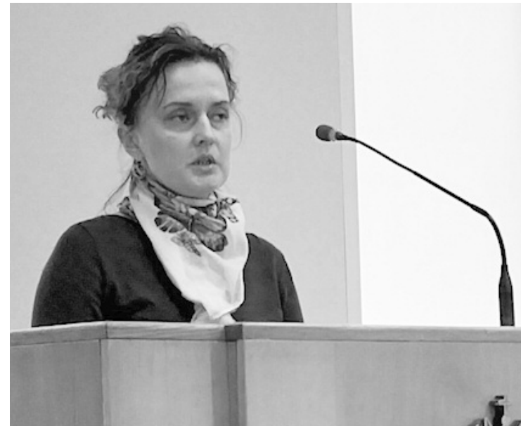
● А. Чеснокова

В рамках акции «Фильтр-допинг» сотрудники Волосовского ОМВД в ночное время посетили места досуга молодежи — в дежурную часть доставлено 18 несовершеннолетних, составлено 12 протоколов по факту продажи алкогольной продукции несовершеннолетним лицам в сетевых магазинах «Магнит» и «Пятерочка», расположенных на территории г. Волосово и района.