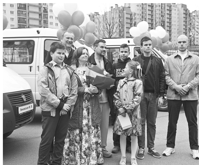
● Получение микроавтобуса от губернатора

Глава семьи не только чародей на кухне, он мастер на все руки — этому и детей учит. Не игнорирует и хлопоты по дому, если у мамы на что-то не хватило времени. Мальчишки — помощники отцу во всем, девочки тоже не отстают. Но им и с мамой интересно — та рукодельни-