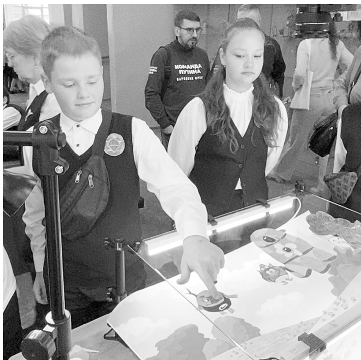
● Работа над мультфильмом